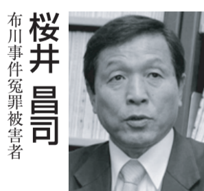
布川事件冤罪被害者