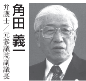
弁護士／元参議院副議長

44年間無実を叫び続けた魂の叫びこそが何より無実の証ではないか。当局は、本人に「改悛の情」を求めていると伝えられている。不遜であり理不尽である。「改悛の情」などあるはずがないではないか。体調を崩していると承っている。万、何かあったら誰が責任をとるのか。取り返しがつかない。